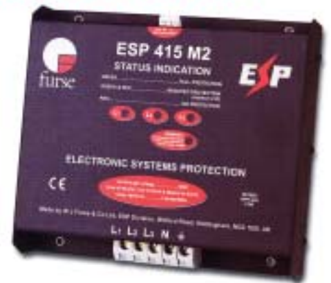
ESP 415 M2, ESP 415 M4