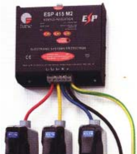
ブレーカーBOXへの取り付け例

電源盤、配電盤内等にスペースがない場合、専用の収納BOXもあります。お問い合わせください。